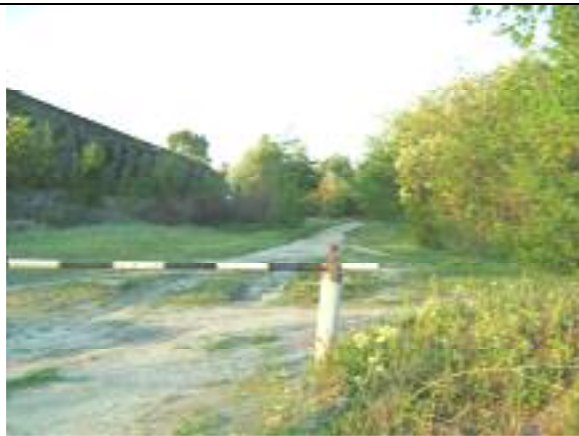
Kettős Körös utca – XVIII. kerületi szakasz