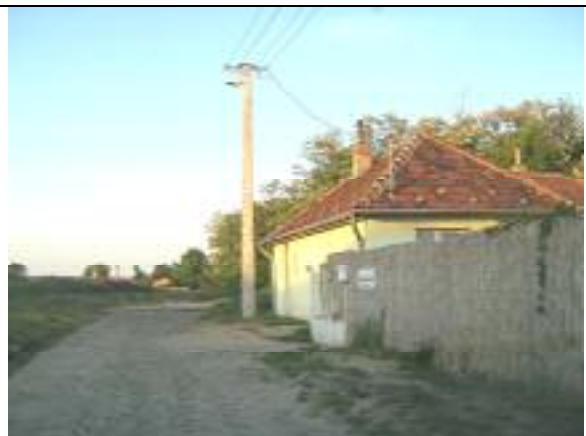
Kettős Körös utca – XVIII. kerületi szakasz