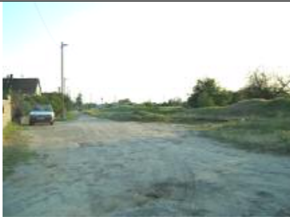
Kettős Körös utca – XVIII. kerületi szakasz