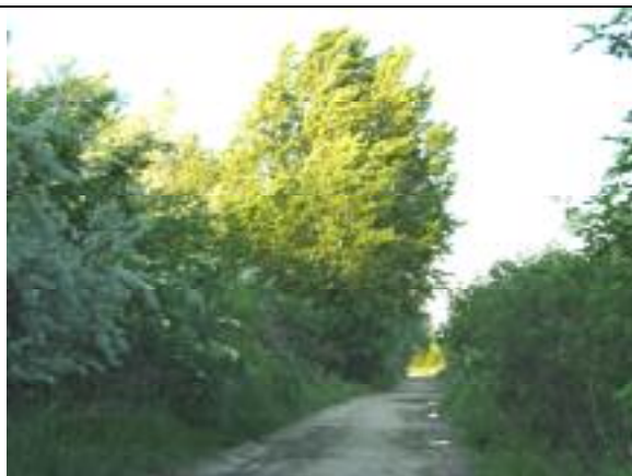
Vecsés út – XXIII. kerületi szakasz