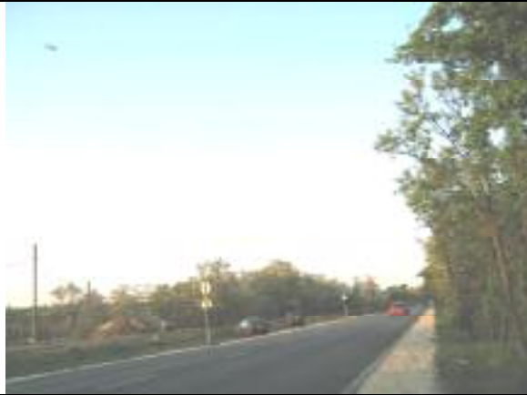
Kettős Körös utca – XVIII. kerületi szakasz