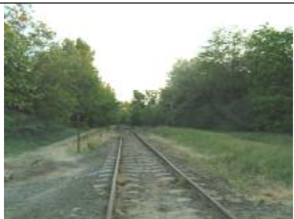
Kettős Körös utca a Flór Ferenc utca felől