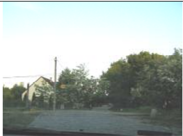
Flór Ferenc utca