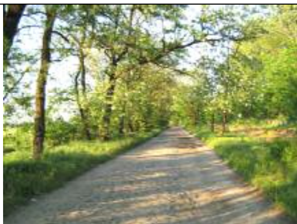
Vecsés út – XXIII. kerületi szakasz