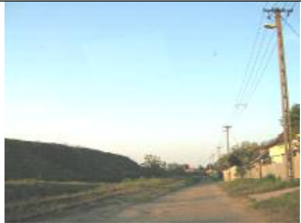
Kettős Körös utca – XVIII. kerületi szakasz