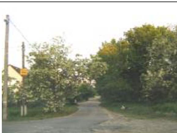
Flór Ferenc utca