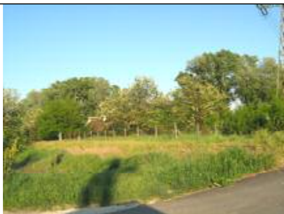
Vecsés út – XXIII. kerületi szakasz