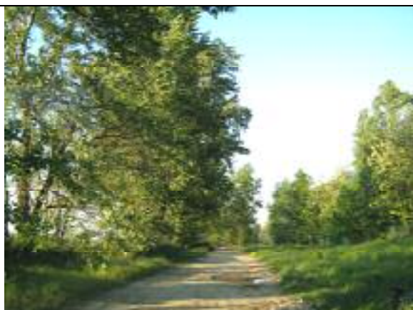
Vecsés út – XXIII. kerületi szakasz