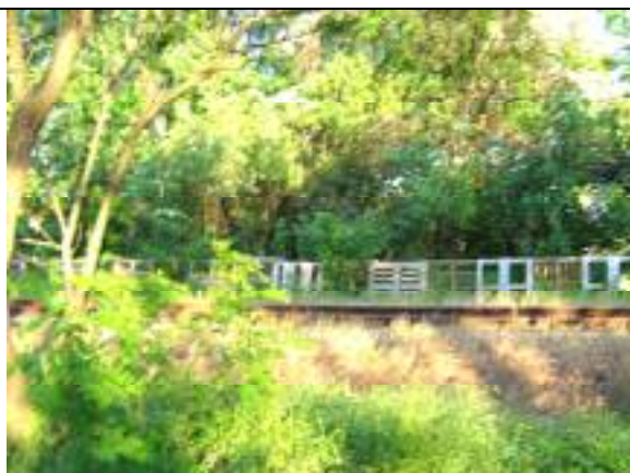
Vecsés út – XXIII. kerületi szakasz