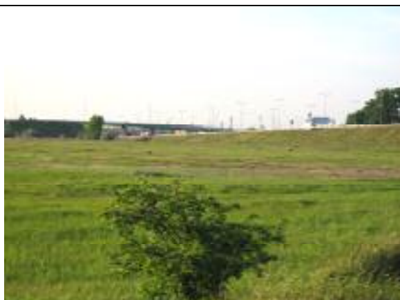
Az M5-ös autópálya a Vecsés út felől