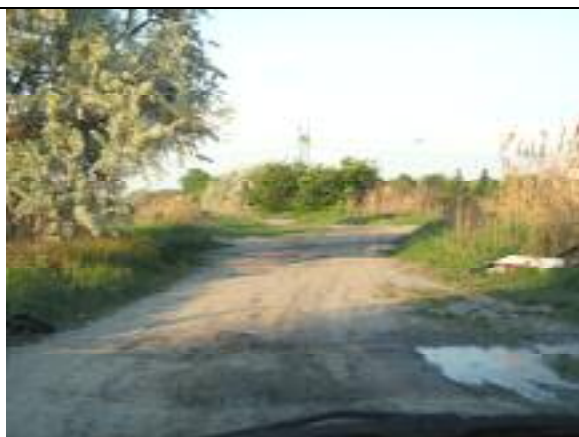
Vecsés út – XXIII. kerületi szakasz