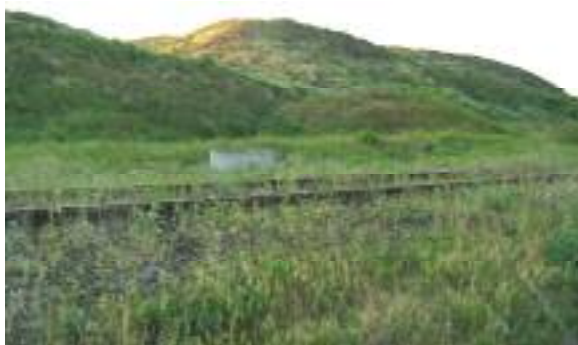
Kettős Körös utca – XVIII. kerületi szakasz