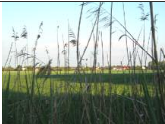
Mezőgazdasági terület a tervezett nyomvonal mellett