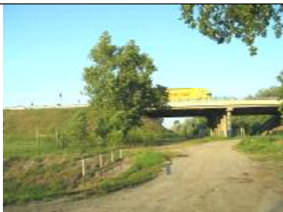
Átjáró az M5-ös autópálya alatt a Vecsés út felől