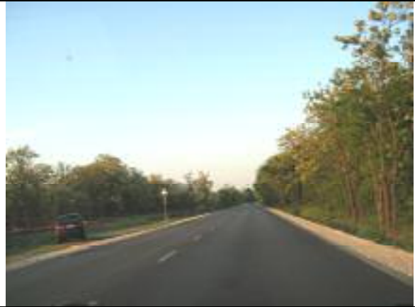
Kettős Körös utca – XVIII. kerületi szakasz