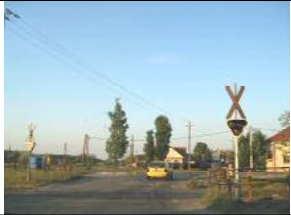
Hunyadi János út – Nagykörösi út vasúti kereszteződés