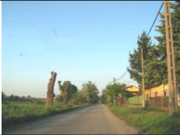
Hunyadi János út – XVIII. kerületi szakasz